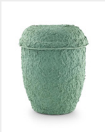
Zelluloseurne (U1) Natur-grün oder beige mit Seilen