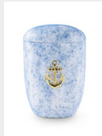
Seeurne (U2) Tonolith-Anhydrit, weiß/blau, MS-Anke