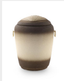
Seeurne (U3) Quarzillith mit Muschelsymbol