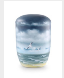
Thalassa Seeurne (U5) Anhydrit-Tonolith, Künstler- Edition Poesie