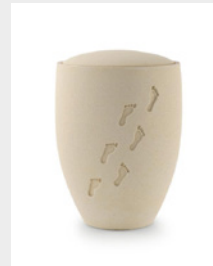
Edition Seeurnen (U4) Sandoberfläche, Spuren im Sand, Anhydrit-Tonolith