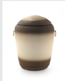
Seeurne (U3) Quarzillith mit Muschelsymbol