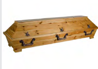
Standard - Kiefer rustikal (S1)