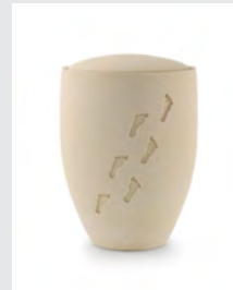
Edition Seeurnen (U4) Sandoberfläche, Spuren im Sand, Anhydrit-Tonolith