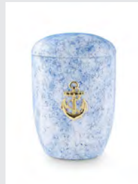
Seeurne (U2) Tonolith-Anhydrit, weiß/blau, MS-Anke