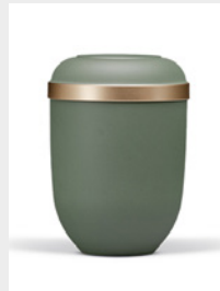
Standard (U1) Naturstoffurne Olive