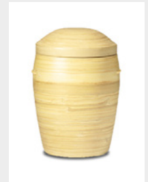
Klassik (U4) Naturstoff - Bambus