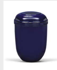
Standard (U3) Naturstoff - blau