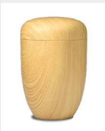
Klassik (U5) Eiche hell mit Folienbeschr.