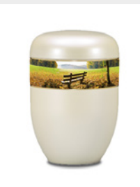
Gehoben (U6) Naturstoff - Park