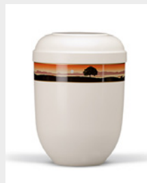
Gehoben (U7) Naturstoff - Sonnenuntergang