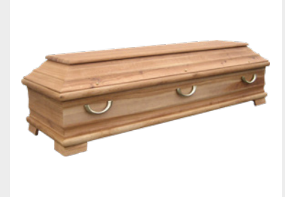
Gehoben - Eiche (S2)