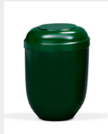
Standard (U2) Naturstoff - grün