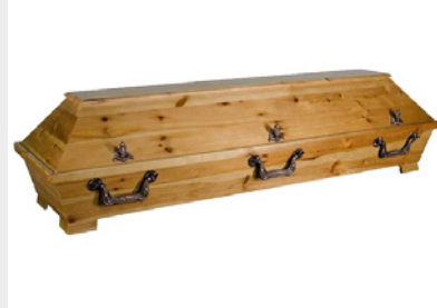
Standard - Kiefer rustikal (S1)