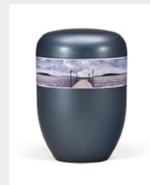
Gehoben (U8) Naturstoff - Seesteg