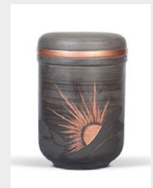
Premium (U9) Keramik - Sonne