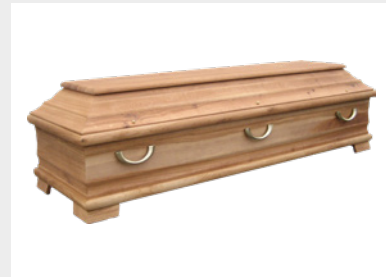
Gehoben - Eiche (S2)