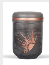
Premium (U9) Keramik - Sonne