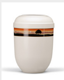
Gehoben (U7) Naturstoff - Sonnenuntergang