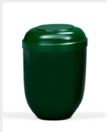
Standard (U2) Naturstoff - grün