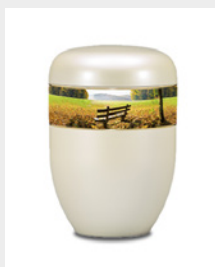
Gehoben (U6) Naturstoff - Park