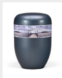
Gehoben (U8) Naturstoff - Seesteg