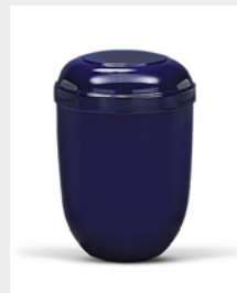
Standard (U3) Naturstoff - blau