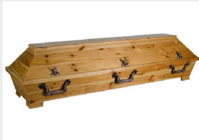
Standard - Kiefer rustikal (S1)