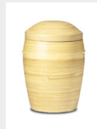
Klassik (U4) Naturstoff - Bambus